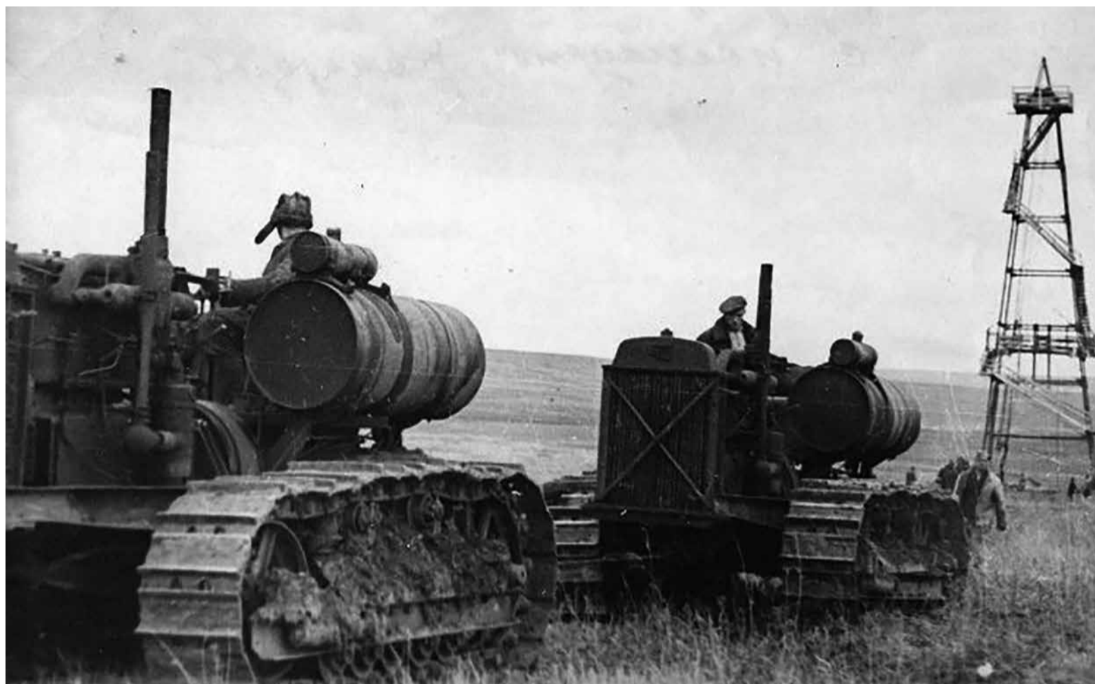
Газовая скважина в Елшанке, 1942 г.