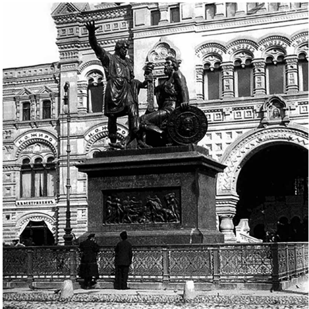
И.П. Мартос. Памятник Минину и Пожарскому на Красной площади в Москве. Сооружен в 1818 г.