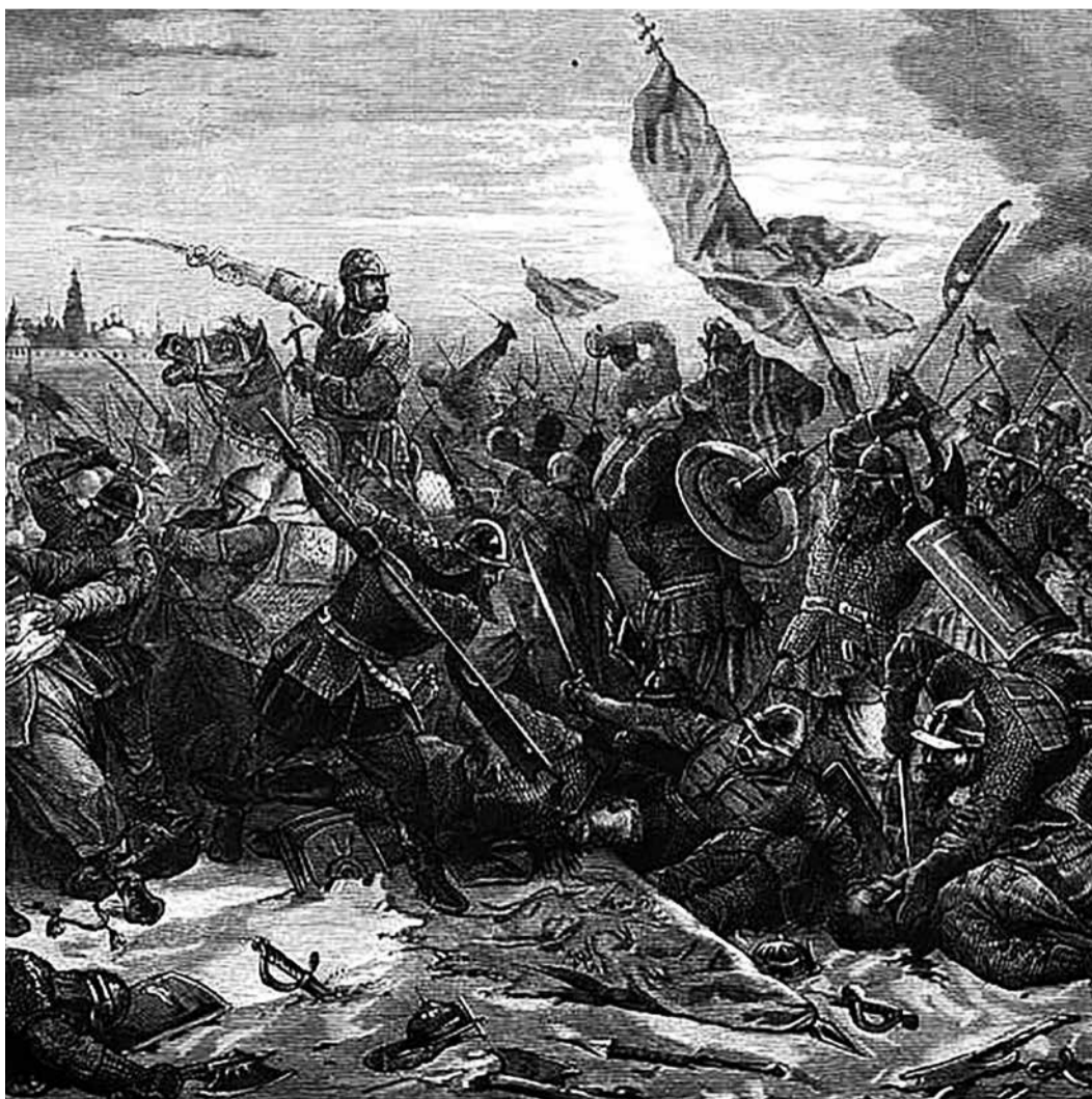
Битва князя Пожарского с гетманом Ходкевичем под Москвой. Событие 1612 г.