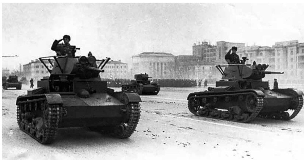
Военная техника на параде в Куйбышеве. 7 ноября 1941 г.