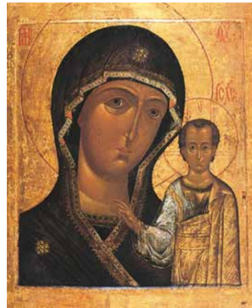
Казанская икона Божией Матери.

Вступил в земскую рать отряд служилых смоленских дворян, которые после падения