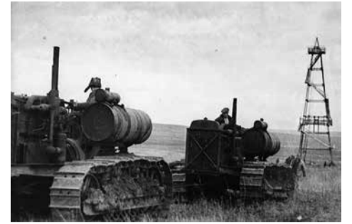
Саратовский газ – для победы!