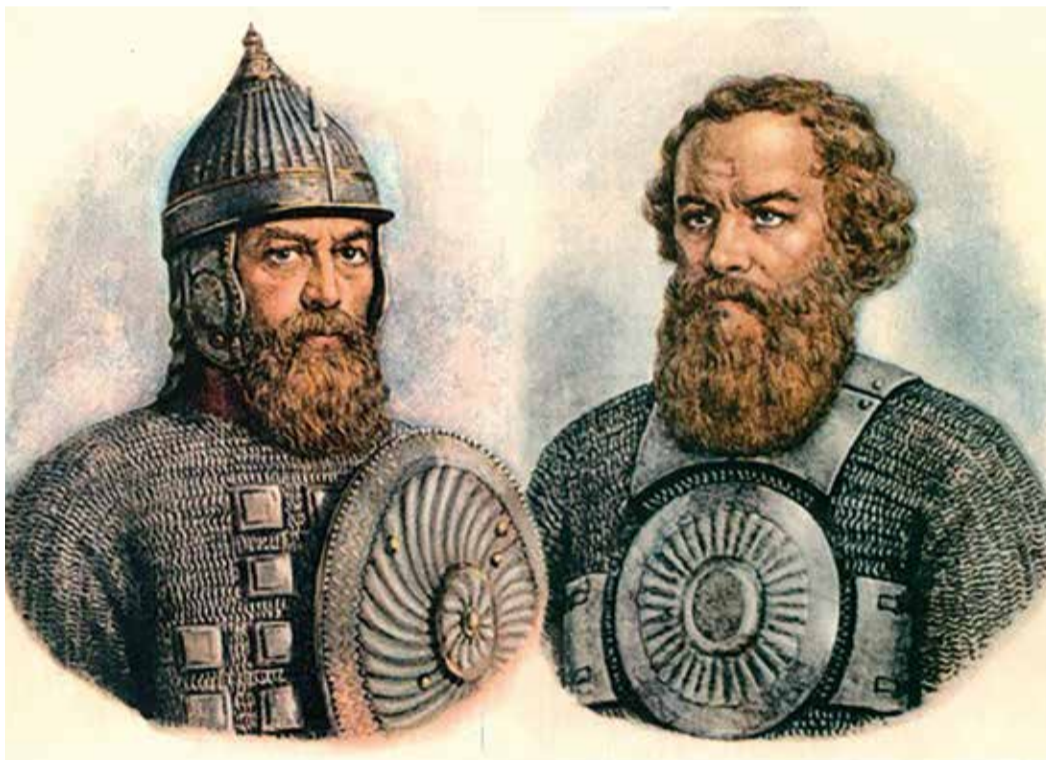
Дмитрий Михайлович Пожарский (1578-1642).