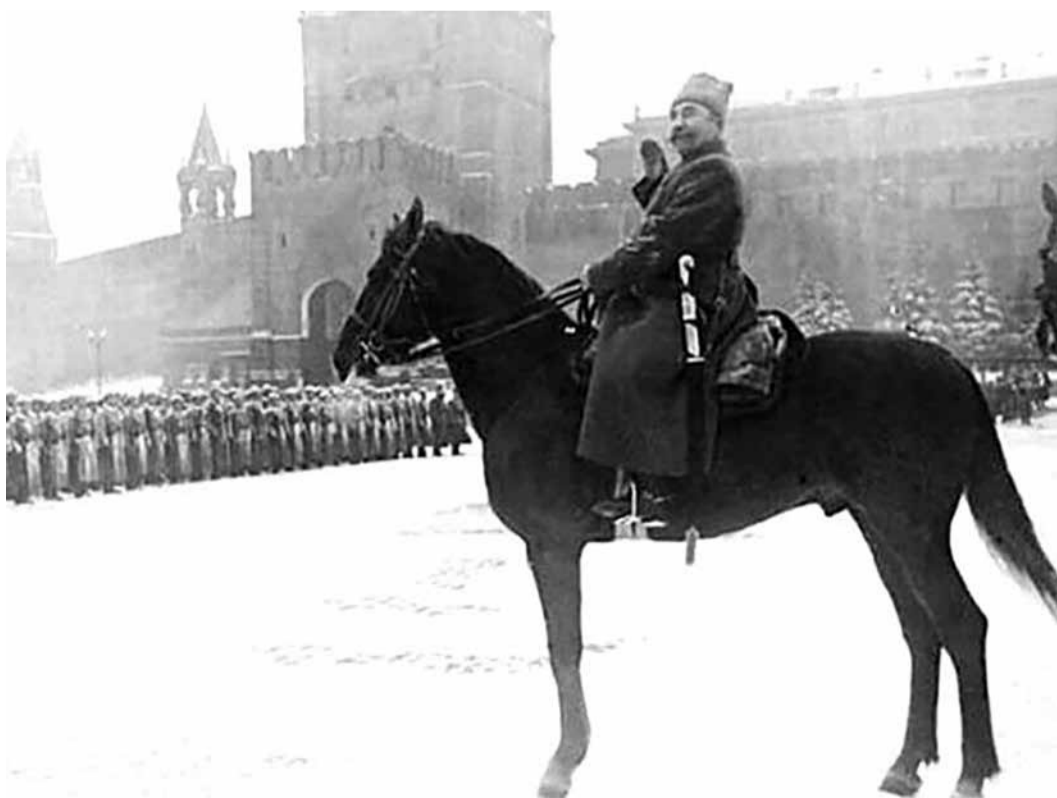
Маршал Советского Союза Семен Буденный принимает парад на Красной площади в Москве, 7 ноября 1941 г.

Из выступления Сталина на параде 7 ноября 1941 года: «...Вероломное нападение немецких разбойников и навязанная нам война создали угрозу для нашей страны. Мы потеряли временно ряд областей, враг очутился у ворот Ленинграда и Москвы. Враг рассчитывал на то, что после первого же удара наша армия будет рассеяна, наша страна будет поставлена на колени. Но враг жестоко просчитался. Несмотря на