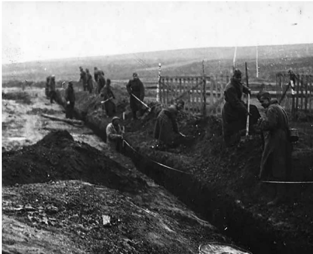
Земляные работы на строительстве газопровода, 1942 г.

Учитывая эти открытия и крайне сложную ситуацию с энергоресурсами в