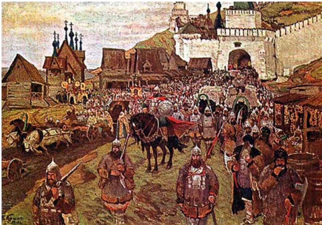
Князь Пожарский во главе ополчения. Хромофотография по картине Т. Крылова. 1910 г.

Поляки, озлобленные тем, что патриарх обличал интервентов и их приспешников, призывал к борьбе русский народ, приговорили его к голодной смерти. Однако это не смирило русского патриота. Из подземной темницы Гермоген продолжал рассылать