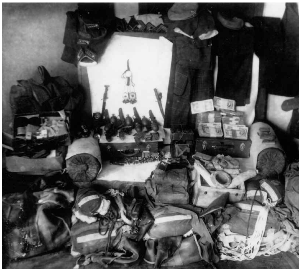
Оружие и снаряжение, изъятые контрразведчиками у диверсантов.