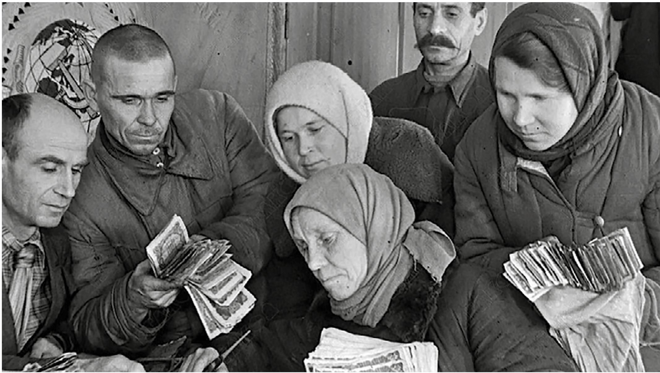
Члены колхоза «Борьба» передают свои сбережения на постройку боевых самолетов для Красной Армии. Январь 1943. Фото сделано в Новосибирской области, но отражает историю во всей стране.