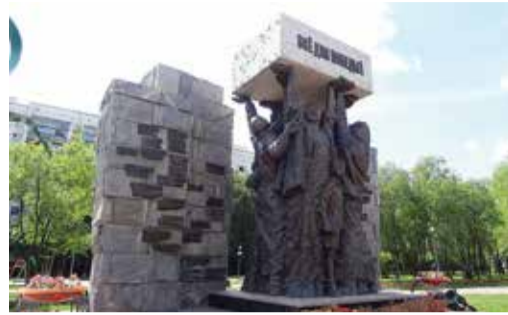
Победа ковалась в сибирском тылу