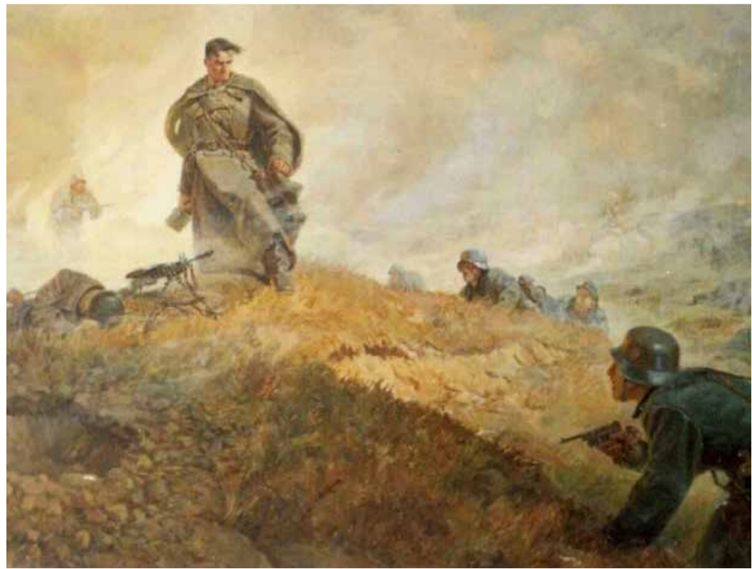
«Последний бой Хусена Андрухаева». Художник А. Чечин.