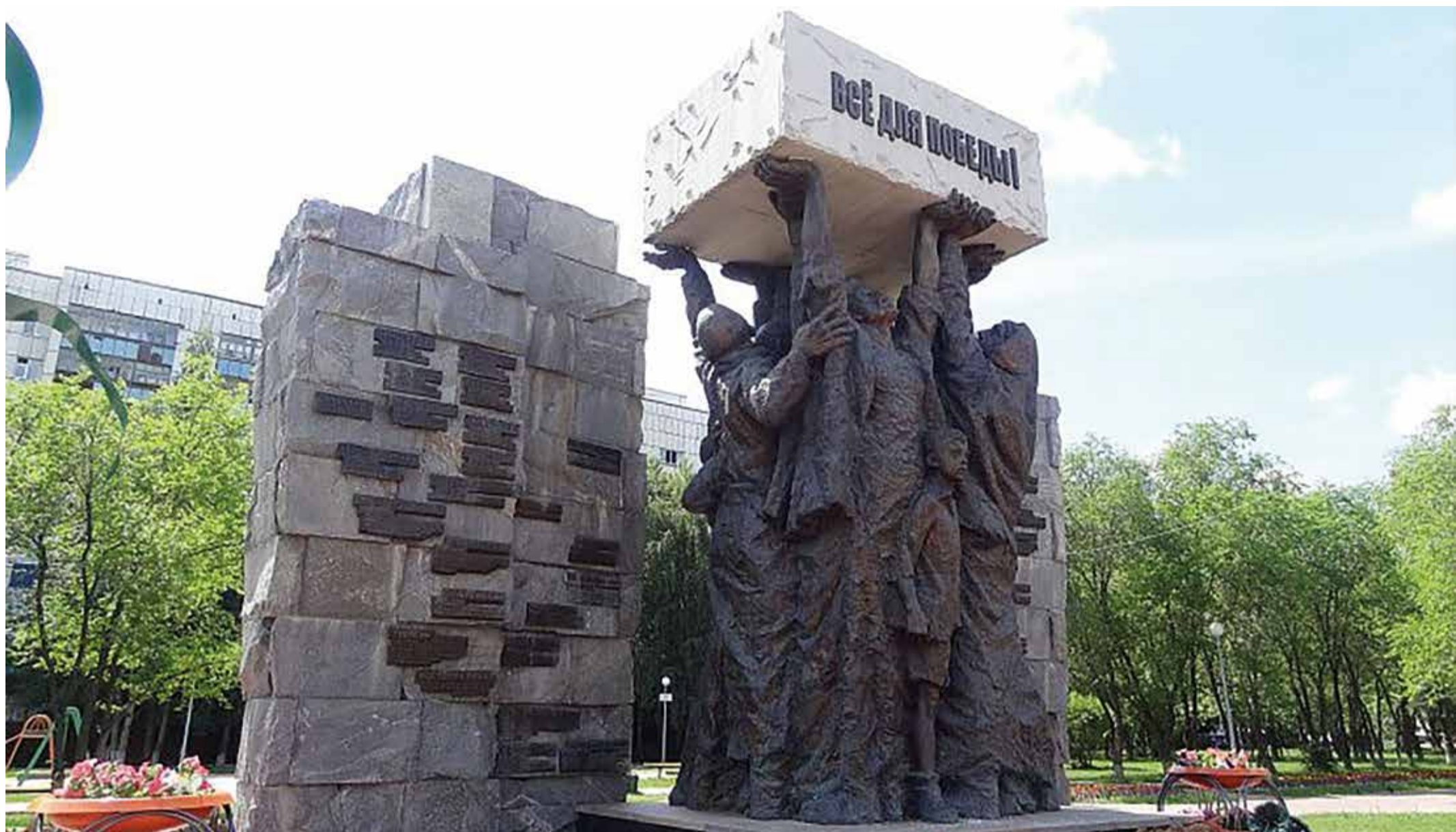
Тюмень. Памятник труженикам тыла.