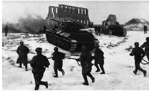
Начало сталинградского перелома