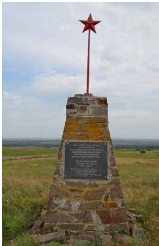
Памятный знак «Дьяковская оборона».