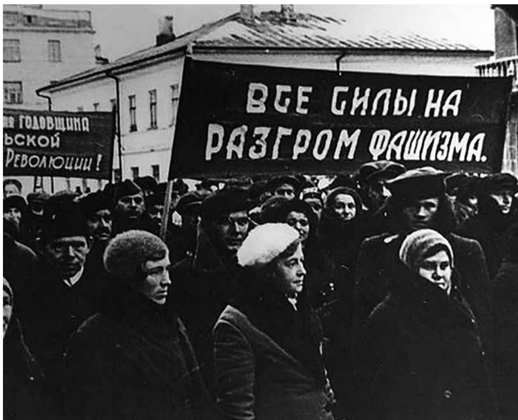
Демонстрация трудящихся в Воронеже, 7 ноября 1941 г.