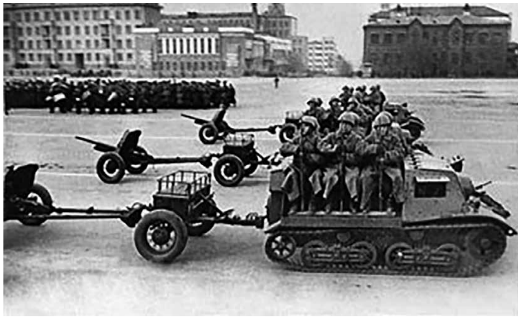
Бронетехника на параде в Куйбышеве, 7 ноября 1941 года