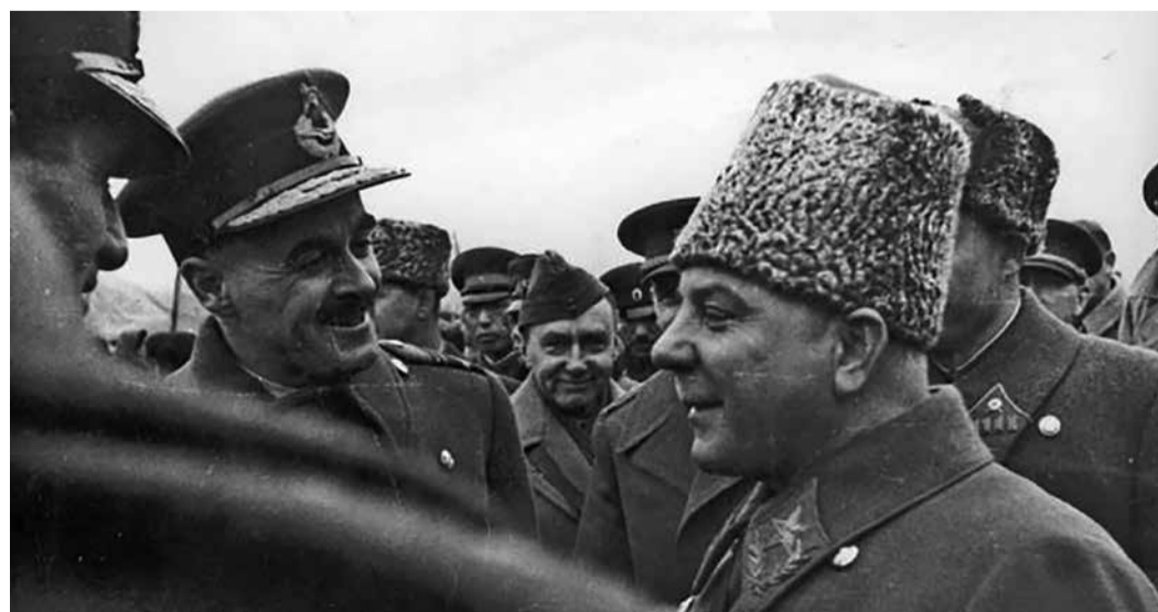
Ворошилов К.Е. и иностранные дипломаты на параде в Куйбышеве. 7 ноября 1941 г.