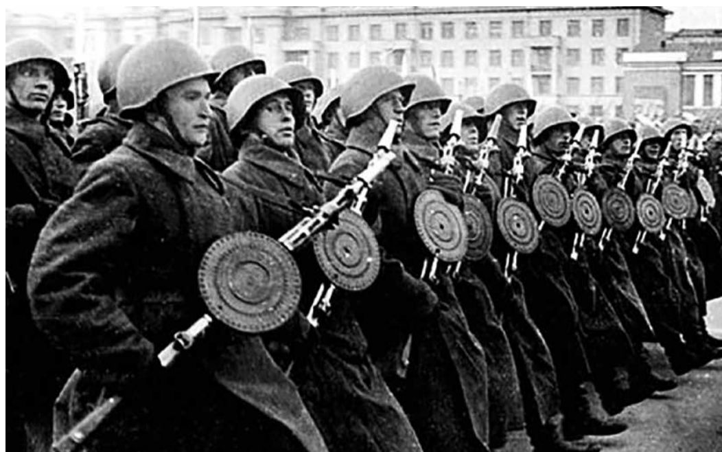
Красноармейцы на параде в Куйбышеве, 7 ноября 1941 г.