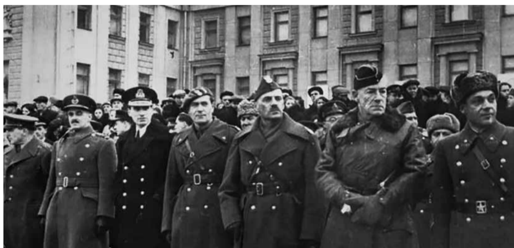
Иностранные дипломаты на параде в Куйбышеве, 7 ноября 1941 г.

событием, свидетелями которого они стали на новом месте.