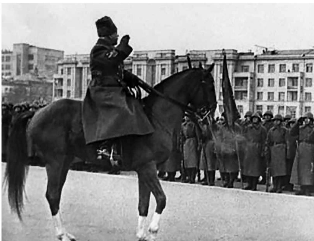
Ворошилов К.Е. на параде в Куйбышеве. 7 ноября 1941 г.

«Организация в Москве обычного, традиционного парада в момент, когда на подступах к городу идут жаркие бои, представляет собой великолепный пример