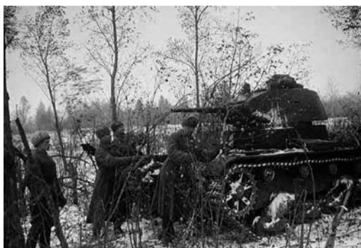
Советские солдаты у танка Т-26 на окраине освобожденной станицы под Сталинградом.

Разработка «Урана» с начала октября шла только на уровне командующих родами войск и высокопоставленных работников