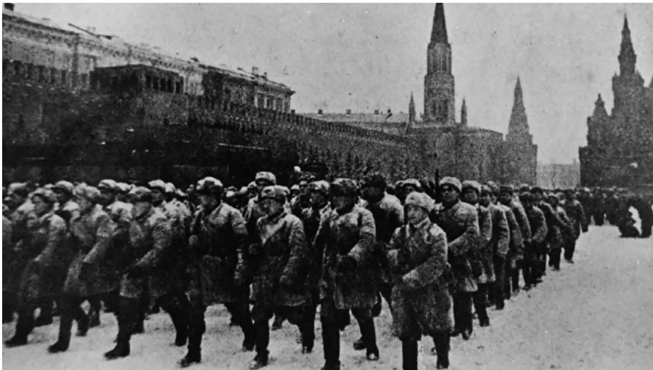
Участники парада на Красной площади, 7 ноября 1941 г.