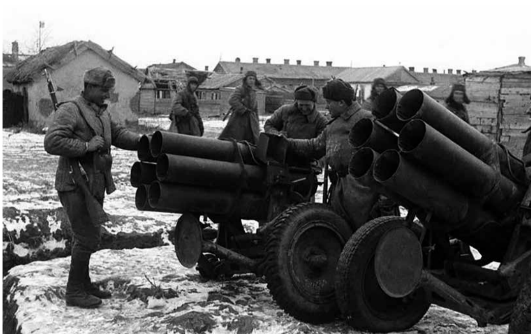
Советские артиллеристы-гвардейцы осматривают захваченные немецкие 150-мм шестиствольные реактивные минометы «Небельверфер» 41 (15 cm Nebelwerfer 41) на Сталинградском фронте.

Генштаба. Командующие войсками и штабы фронтов включились в процесс только в октябре, но они не знали общего замысла и готовили планы боевых наступательных операций в тыл группировки противника исключительно собственными силами. На уровне армий и фронтов подготовка к наступлению началась только в конце октября — начале ноября. Командармы также не знали общего плана, а указания от командующих фронтов получали в устной форме. Командиры дивизий узнали о наступлении только в ноябре, а сам план «Уран» утвердили только 7 ноября, за 12 дней до его реализации.