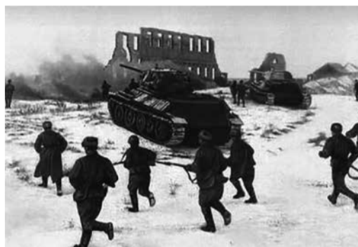
Советские войска продолжали наступление.